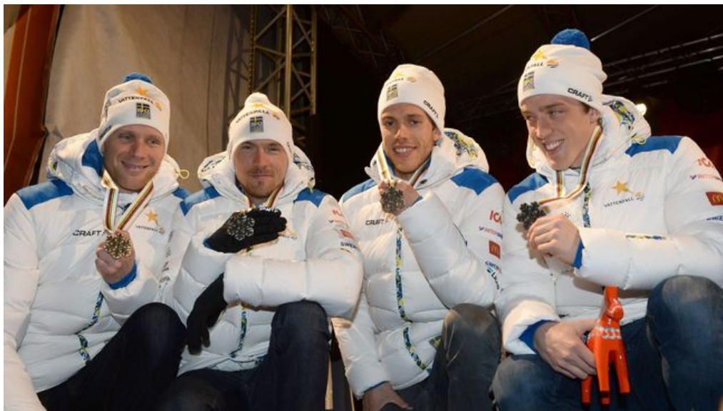
Daniel Rickardsson var med och tog stafettsilver vid VM i Falun

För tävlingsresultaten hänvisar vi till IdrottOnlines tävlingskalender.